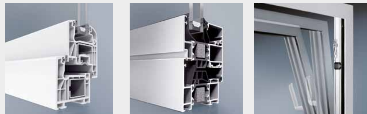
BE Kunststofffenster Corona S

Für die bestmögliche Sicherheit Ihrer Fenster muss das gesamte Produkt stimmen. Das fängt schon bei den Profilen an. BE Fenster aus Kunststoff oder Aluminium bieten eine große Basissicherheit mit hoher Bautiefe und weit innen liegenden Beschlägen, die dem Einbrecher