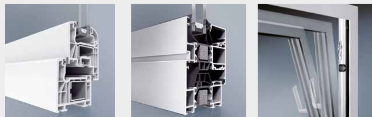
BE Kunststofffenster Corona S

Für die bestmögliche Sicherheit Ihrer Fenster muss das gesamte Produkt stimmen. Das fängt schon bei den Profilen an. BE Fenster aus Kunststoff oder Aluminium bieten eine große Basissicherheit mit hoher Bautiefe und weit innen liegenden Beschlägen, die dem Einbrecher