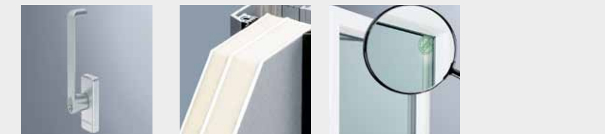
Abschließbarer Griff Für Drehkippfenster, Schiebe- und Hebeschiebetüren bietet BE Bauelemente ein Sortiment abschließbarer Griffe in verschiedenen Ausführungen und Designlinien an.