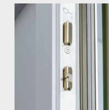
Sicherheits Schloss Schüco SafeMatic

Erste Anlaufstelle für Einbrecher ist die Tür. Deshalb sind hier die Sicherungsmöglichkeiten besonders umfangreich, vom Sperrbügel oder Sicherheitsprofilzylinder über Mehrfachverriegelung bis hin zu elektronischen Schließsystemen, die gleichzeitig ein hohes Maß an Bedienungskomfort bieten.