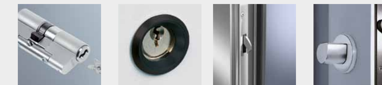
Sicherheitsprofilzylinder Das Herzstück des Türschlosses – nahezu fälschungssicher und mit Kernziehl- und Aufbohrschutz gegen Gewalt einwirkung geschützt.