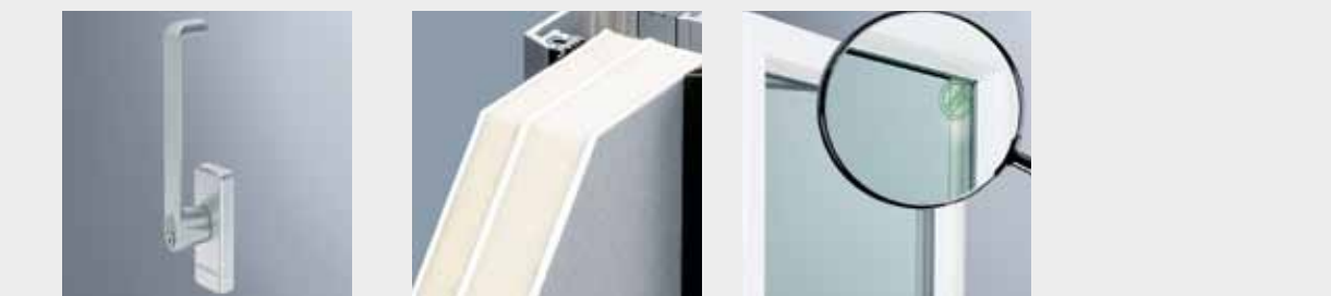
Abschließbarer Griff Für Drehkippfenster, Schiebe- und Hebeschiebetüren bietet BE Bauelemente ein Sortiment abschließbarer Griffe in verschiedenen Ausführungen und Designlinien an.