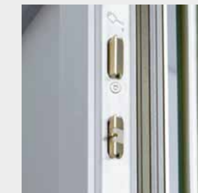
Sicherheits Schloss Schüco SafeMatic

Erste Anlaufstelle für Einbrecher ist die Tür. Deshalb sind hier die Sicherungsmöglichkeiten besonders umfangreich, vom Sperrbügel oder Sicherheitsprofilzylinder über Mehrfachverriegelung bis hin zu elektronischen Schließsystemen, die gleichzeitig ein hohes Maß an Bedienungskomfort bieten.