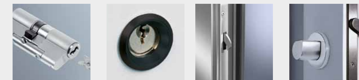
Sicherheitsprofilzylinder Das Herzstück des Türschlosses – nahezu fälschungssicher und mit Kernzieh- und Aufbohrschutz gegen Gewaltwirkung geschützt.