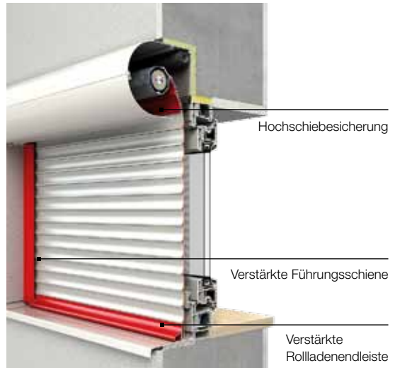
Sicherheitsstufe 1 ROMA Sicherheitspaket